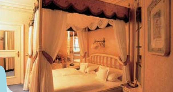
Hotel Bachmair am See